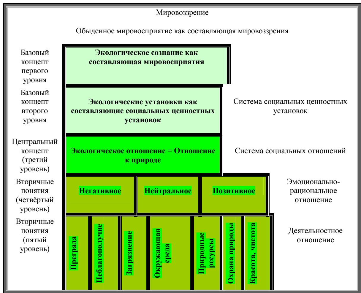
Структура концептуального поля «экологическое сознание»

Таким образом, мы «выстраиваем» – фиксируем логику взаимосвязи, определяем и уточняем – следующую иерархию понятий, схематически представленную на рис. 1. В